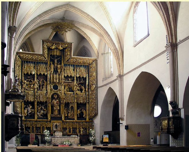
Vista parcial de la nave mayor de la iglesia de San Pablo

El Año Jubilar se celebrará de forma privilegiada en Roma en la Basílica de San Pablo Extramuros (donde se encuentra el sepulcro con los restos del Apóstol), y por disposición papal podrán realizarse actividades especiales en otros lugares de culto relacionados con San Pablo o que lleven su nombre. Pero además, por decreto de la Penitenciaría Apostólica Vaticana de 13 de mayo de 2008 la Insigne Iglesia Parroquial de San Pablo Apóstol de Zaragoza goza del eminente y singular honor de haber sido designada como sede jubilar , lo que significa que durante todo el Año Paulino se podrán obtener en ella las gracias espirituales del jubileo del mismo modo que en la basílica romana.