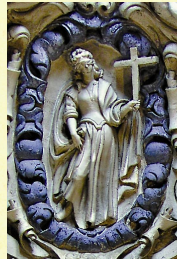
Representación de la Fe en la cúpula de la capilla de Nuestra Señora del Pópulo (1673)