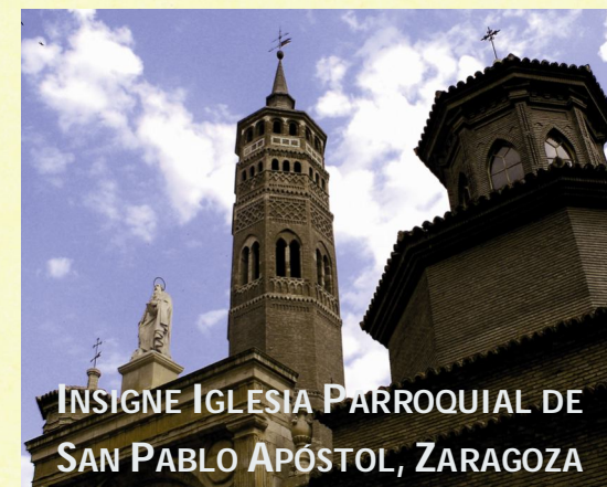
INSIGNE IGLESIA PARROQUIAL DE SAN PABLO APÓSTOL, ZARAGOZA