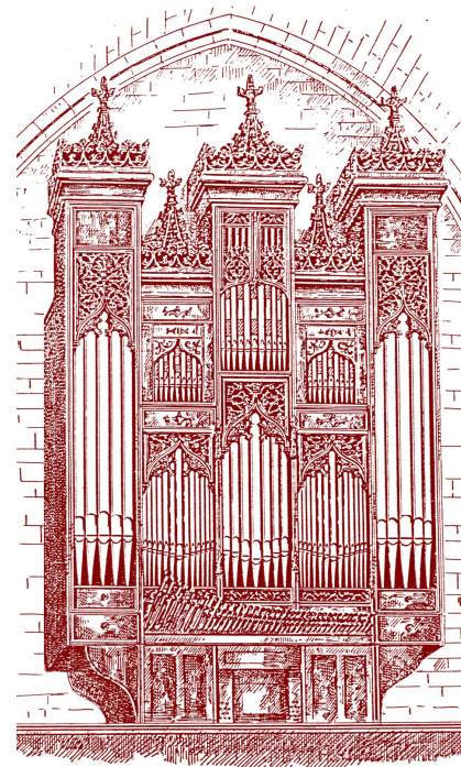
ÓRGANO DE SAN PABLO (1483)

Según rezan los libros parroquiales Sebastián Aguilera de Heredia fue bautizado en la iglesia de San Pablo el 15 de agosto de 1561. Creció también en este barrio zaragozano, donde disfrutó del esplendor de la música litúrgica de su iglesia parroquial, en cuyo órgano, tañido siempre de manera magnífica, pudo ir aprendiendo; de hecho, tras su ordenación sacerdotal en 1584 entró a formar parte del clero de la Parroquia y es de suponer que se ocuparía de su capilla de música y del órgano con suma eficiencia, pues un año más tarde, en 1585, fue nombrado organista titular de la catedral de Huesca. En tal cargo permaneció 18 años; durante ellos compuso las formidables obras que le siguen dando renombre porque fueron decisivas para la evolución de la música de tecla en España iniciada por Antonio de Cabezón, cuya producción organística desarrolló Aguilera hasta límites de gran perfección.