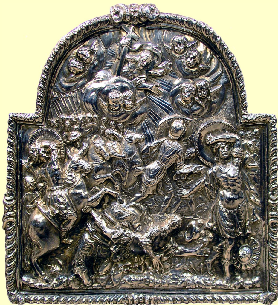
La conversión de Saulo. Detalle del frontal del altar mayor (1711, Pablo Pérez)