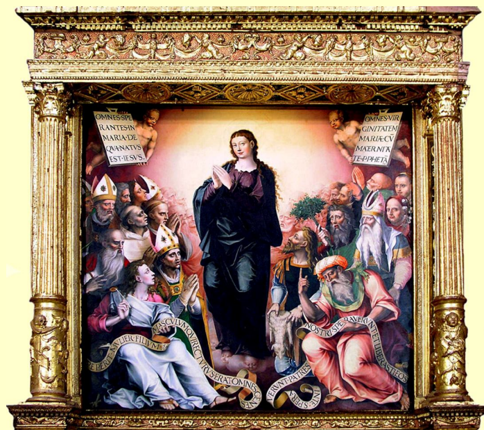
Nuestra Señora de la Esperanza (tabla de mediados del s. XVI, Jerónimo Cossida; predela del retablo mayor)